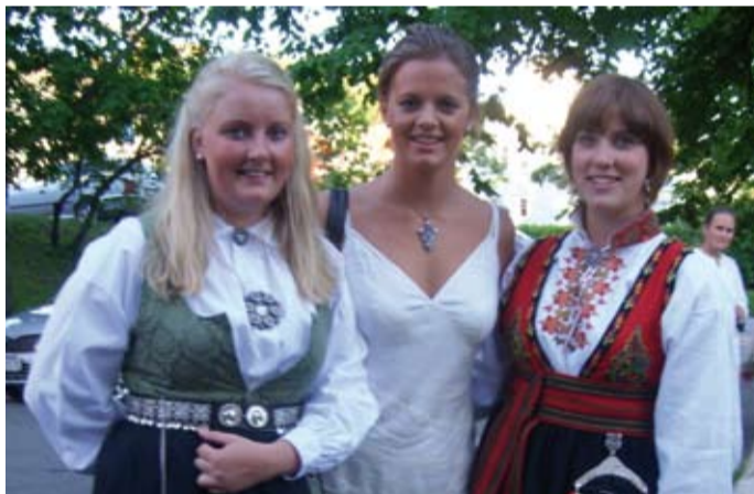
Tre forventningsfulle Nepal-vener

Du kan stø Helselag til Nepal sitt arbeid ved å sende pengar til konto nummer 6045 09 15745. Pengane går uavkorta til helselagsarbeidet på landsbygda i Nepal.