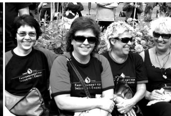
Fire kampvillige kvinner i kraftdemonstrasjon

har lovet å skaffe oss et energikraftregime, men har ikke levert det de lovet. Vi føler at regjeringa har ført en veldig dårlig industripolitikk. Vi må bruke mikroskop for å se forskjellen mellom Bondevik-regjeringa og den nye rød-grønne regjeringa, når det gjelder industripolitikk, sa han.