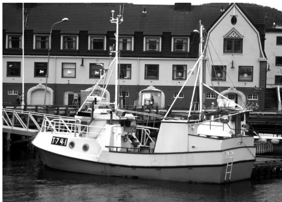
I 2005 var det registrert 7700 fiskefartøyer i Norge. Av disse var 6900, eller nesten 90 %, under 15 meter. De sysselsatte over halvparten av alle registrerte fiskere. Bildet viser en sjark på 9,44 meter.

– Alles, det vil si ingens eiendom. Naturen skal ikke være enkeltes eiendom. Ikke kapitalvare i et marked. Sammenlikn fisken med fossekraft-