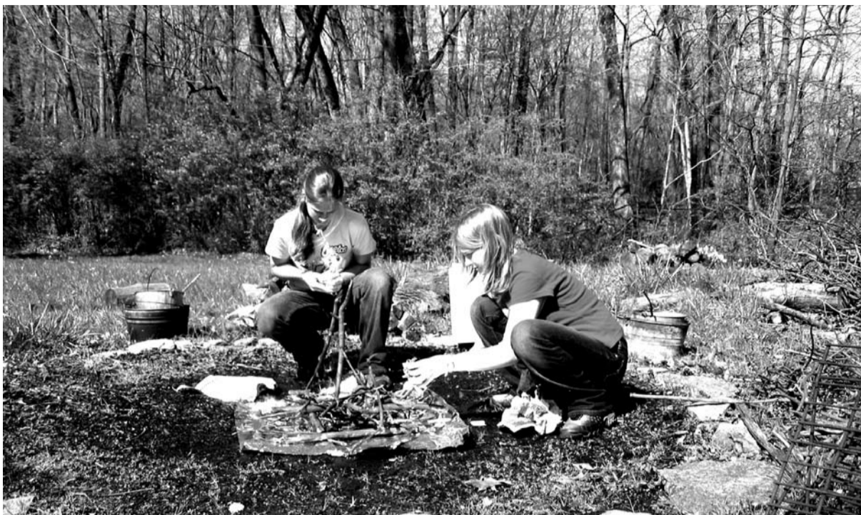
Mette og Marit i forberedelseskomiteen. Snart velter 300 røde ungdommer inn på Utøya.

ikke minst dekket reise. Skriv datoen opp i kalenderen allerede nå, og meld deg på i dag!